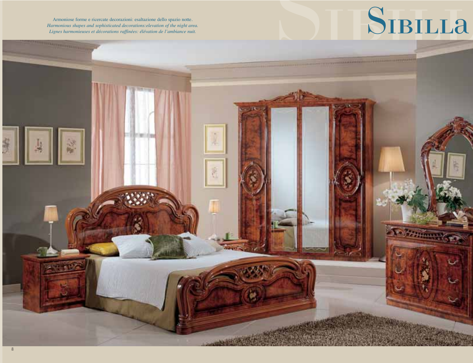
Armoniose forme e ricercate decorazioni: esaltazione dello spazio notte. Harmonious shapes and sophisticated decorations: elevation of the night area. Lignes harmonieuses et décorations raffinées: élévation de l'ambiance nuit.