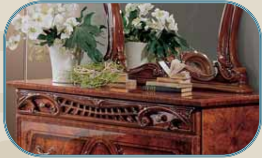
Pezzi unici sapientemente interpretati nelle essenze 'radica noce' e 'radica beige'. Unique pieces wisely interpreted in walnut and cream finish. Éléments uniques bien interprétés dans les essences racine de noyer et racine beige.